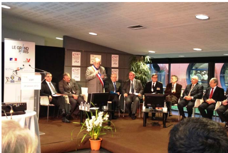
LE GRAND PARIS 26 janvier 2012

L'État a participé activement durant l'année 2012 à l'élaboration des quatre contrats de développement territorial (CDT) du Val-d'Oise, en partenariat étroit avec les collectivités locales à travers des comités de rédaction réguliers destinés à élaborer et approfondir tous les volets du CDT.